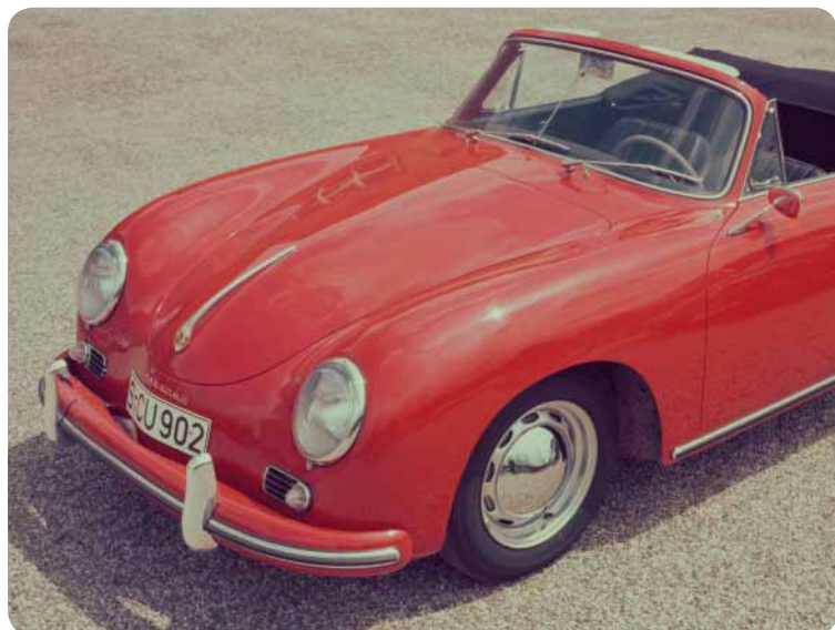
Porsche 356 A Cabriolet In seiner aerodynamischen Linienführung erinnert er an die Berlin-Rom-Wagen von 1939.