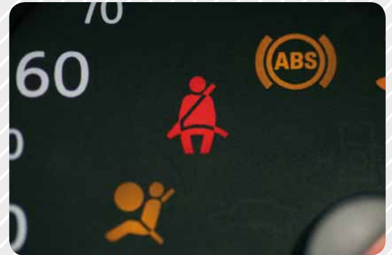
Seite 04 Sicherheitsgurt Der Dreipunkt-Sicherheitsgurt feiert runden Geburtstag.