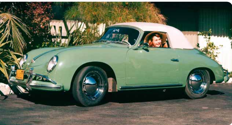
Porsche 356 A Cabriolet Im April 1965 endete die Produktion der Baureihe 356; 76.302 Wagen wurden gebaut.