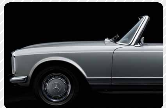
Seite 16 Autos statt Aktien Nie waren sie so wertvoll wie heute.