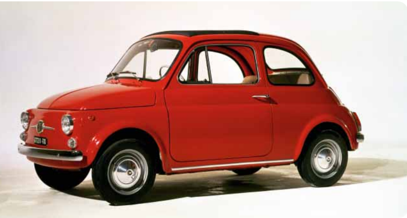
Fiat 500 Knuddelig wie ein Hundebaby und nur ein kleines bisschen größer als ein Spielzeugauto: Muttis Liebling in den 60er-Jahren.