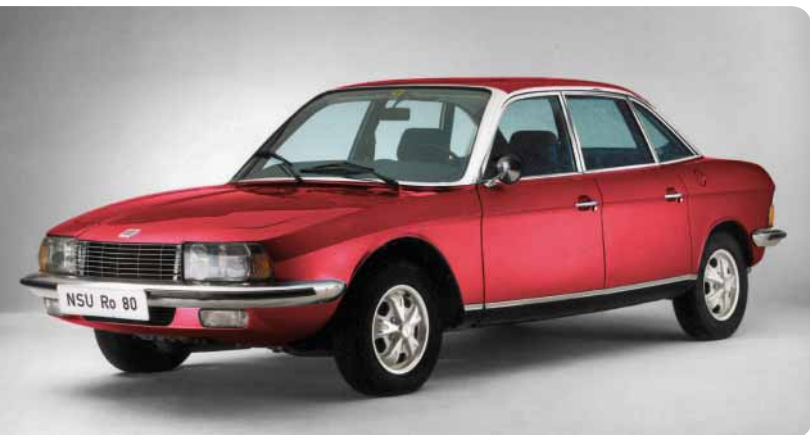
NSU Ro 80 Limousine der gehobenen Klasse Ende der 60er-Jahre vom deutschen Automobil-Hersteller NeckarSUIm.